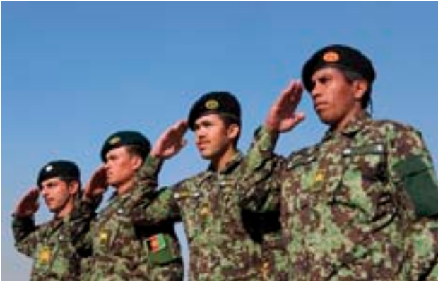
Onderofficieren van het Afghaanse Leger bij een plechtigheid op het einde van hun opleiding

gedaan hebben. We mogen dus vertrouwen hebben dat tegen eind 2014 de Afghaanse militaire capaciteiten zullen voldoen aan de verwachtingen en onze inspanningen bekroond zullen worden. De prijs van deze inspanningen wordt vooral betaald door onze eenheden, die periodiek een be-