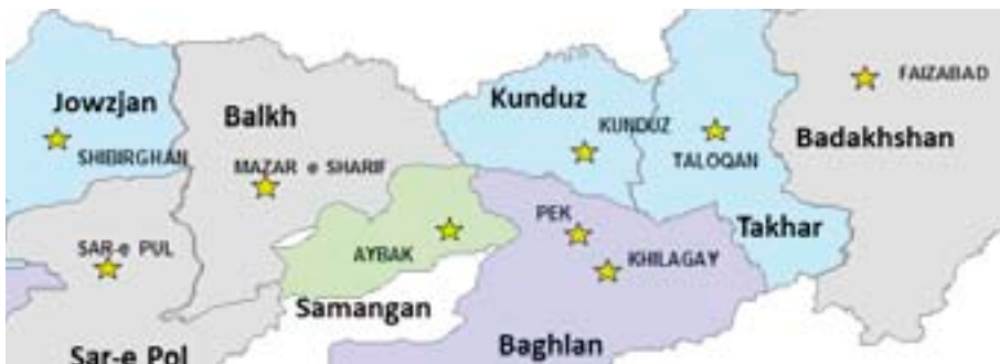
Noord-Afghanistan – met de verschillende provincies die in de zone van Regional Command North vallen.

La Défense belge participe depuis janvier 2009 à l'encadrement de l'armée nationale afghane (ANA) dans le nord de l'Afghanistan. Des militaires belges y supervisent un kandak ou bataillon de l'ANA. Conjointement avec nos collègues allemands, nous assurons en outre l'encadrement de l'état-major de la brigade à laquelle appartient ce bataillon. Cette mission est l'une des plus exigeantes pour notre cadre en termes de risque, d'intensité et de complexité. Cinq équipes de mentorat de compagnie, une équipe au niveau du kandak et les mentors de l'état-major de la brigade sont préparés à leur mission durant six mois. Ils doivent, sur place, faire preuve de beaucoup de patience et de respect dans l'accompagnement de leurs collègues afghans. La date de fin de mission ayant été fixée par les États-Unis au 31 décembre 2014, un certain caractère d'urgence devient progressivement perceptible.