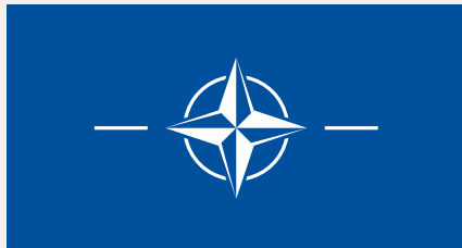
Fig. De nieuwe NAVO-commandostructuur