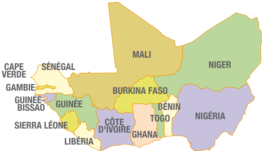
Economic Community of West African States (ECOWAS)

ring te verjagen, óók uit het noorden van het land, en aldus de doelstellingen van de AFISMA en de EUTM te vrijwaren. Ons land neemt deel aan zowel de operatie Serval als aan de EUTM Mali.