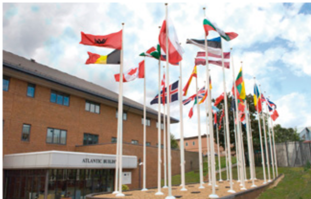
Het gebouw van MARCOM

Op de NAVO-top van Lissabon in november 2010 hebben de staatshoofden beslist de commandostructuur en de agentschappen van de verdragsorganisatie te stroomlijnen en vooral af te slanken. Deze beslissing past in de zoektocht naar een grotere efficiëntie, lees verminderde werkingskosten en personeelsbijdragen, in een context van permanente druk op het defensiebudget en het militaire personeelsbestand van de