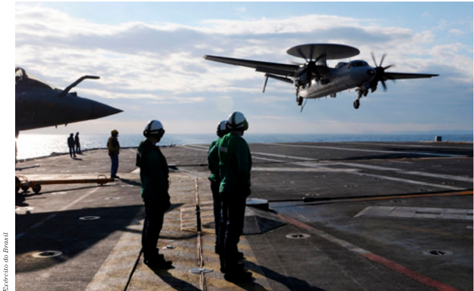
Exército do Brasil

Tegelijkertijd met het gedetailleerd uittekenen van de verantwoordelijkheden moeten eveneens de gevechtsorganisatie en het hele trainingsschema aangepast worden aan de dubbele commandorol. De JFMCC-structuur wordt omgevormd tot een Maritime Battle Staff (MBS) om ook de staf- en commandoactiviteiten van operationeel niveau te kunnen verzekeren. Het gewijzigde trainingsschema moet toelaten de twee commandorollen te oefenen en MARCOM's commando-capaciteiten te bewijzen voor het verklaren van Full Operational Capability