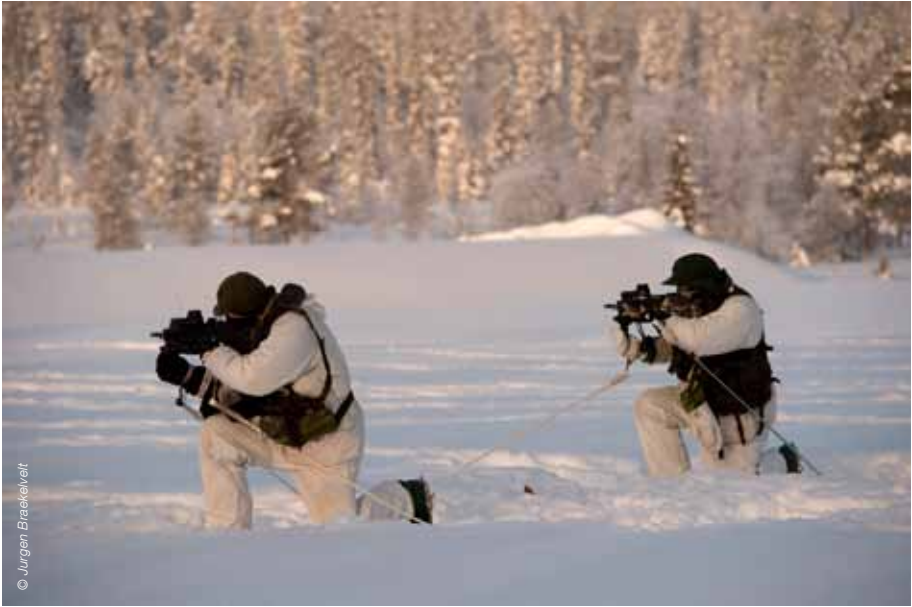
Cold Response 2014

Ons land beschikt dus nu al over beperkte capaciteiten binnen de Land- en Luchtcomponenten om in koude klimaatomstandigheden te kunnen opereren. De ontwikkeling van een NAVO-strategie voor het Hoge Noorden zal echter het NDPP ook beïnvloeden: extra capaciteiten voor de specifieke bedreigingen en klimaatomstandigheden van het Hoge Noorden zullen in het document vermeld worden. Het is dus evenmin onwaarschijnlijk dat er in de toekomst nieuwe inspanningen aan België gevraagd worden, onder andere in het domein van de maritieme operaties. Deze optie wordt al door Nederland in het kader van de vervanging van zijn fregatten bestudeerd.