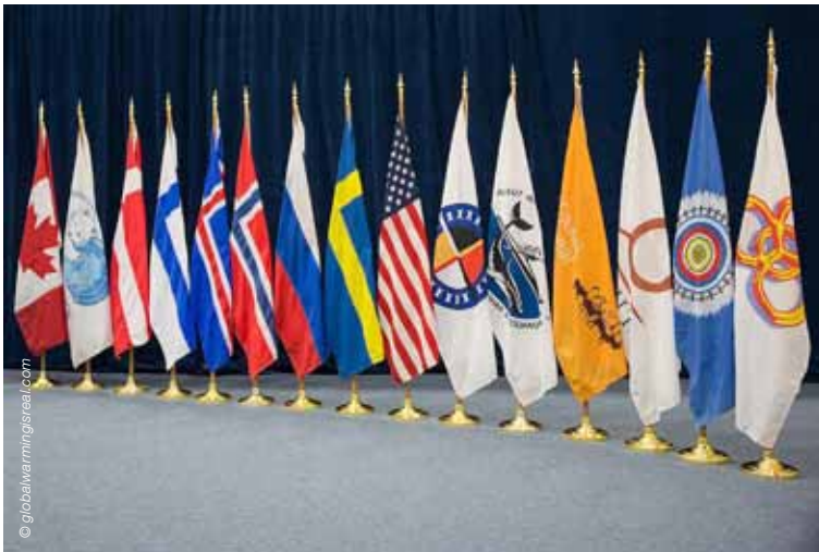
Permanente leden van de Arctische Raad

De huidige budgettaire beperkingen van de Arctische kustlanden belemmeren echter hun investeringsambities, zelfs is er al in bepaalde domeinen veel vooruitgang geboekt. Noorwegen beschikt bijvoorbeeld nu al over de beste uitgeruste SAR-basis voor Arctica. Rusland blijkt ook over meer capaciteiten en over wat budgettaire ruimte te beschikken voor de implementatie van zijn in 2008 goedgekeurde overheidsbeleid dat duidelijk de verschillende uitdagingen van het land in de regio en de middelen beschrijft die nodig zijn voor zijn implementatie. Deze verklaring is echter te nuanceren doordat het land ook over de grootste en meest geëxploiteerde Arctische kust beschikt en dat de huidige investeringen vooral zijn militaire aanwezigheid in de regio dienen te versterken.