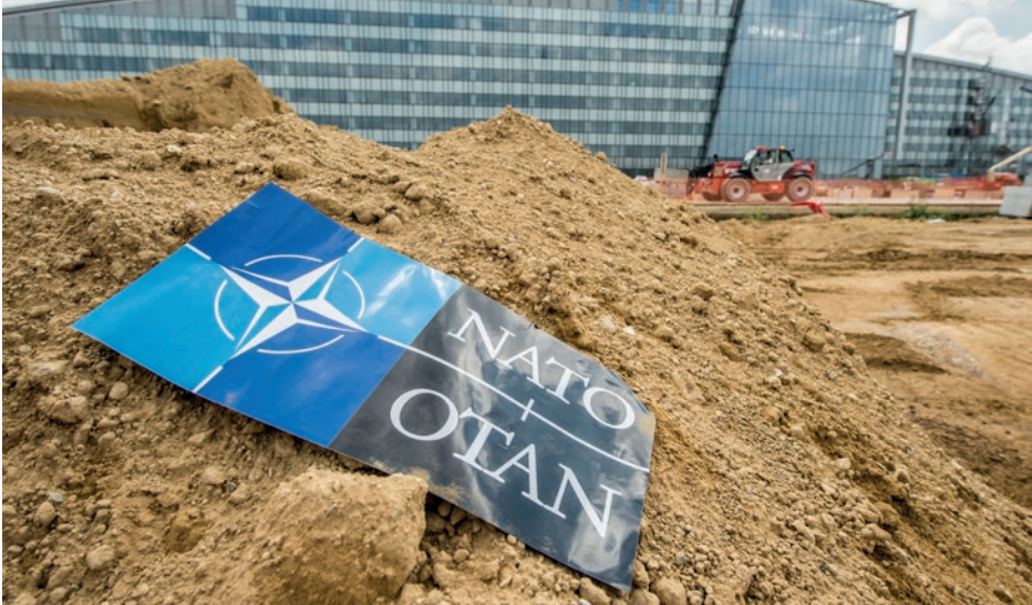
NATO strategy ... under construction?

Het is daarom weinig geloofwaardig te verwachten dat de grotere en coherenter troepenmachten die nodig zijn tegenover de oostelijke dreiging zomaar on-call kunnen worden bijeengesprokkeld vanuit de verschillende eenheden en landen om dan – ondanks de beste wil, kennis en ervaring – binnen slechts enkele uren het defensief te organiseren en winnen.