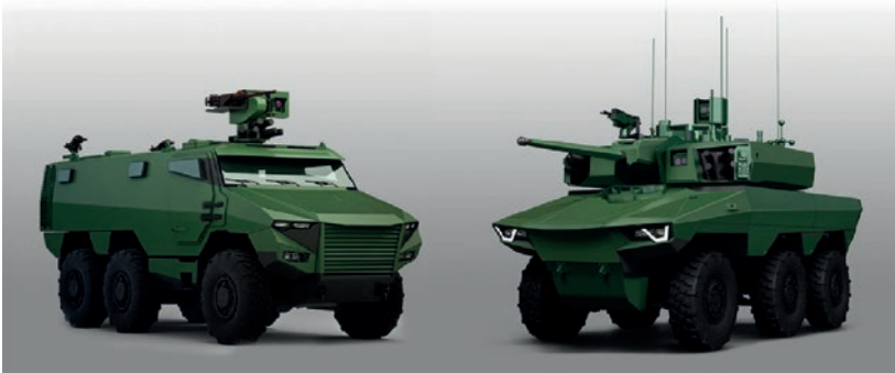
De Franse voertuigen GRIFFON en JAGUAR

Enige realiteitszin toont hierin onmiddellijk de meerwaarde van een verdere Europese defensiesamenwerking en -integratie, naar het voorbeeld van de lopende initiatieven met onder meer Nederland, Denemarken en Frankrijk. Enerzijds kan dit de Europese NAVO-lidstaten inderdaad stimuleren om de dringende doch dure investeringen in high-end warfare -landcapaciteiten en de bijhorende interwapen en joint ondersteuning gezamenlijk en binnen hogere, permanente structuren op divisie- en korpsniveau te organiseren. Anderzijds kan dit ook de interoperabiliteit en de gemeenschappelijke, maatschappelijke dreigingsperceptie onder de Europese lidstaten en bevolking verhogen. In het licht hiervan vormt de recente letter of intent voor een Frans-Belgische samenwerking op het niveau van de gemotoriseerde landcapaciteit zeker een beloftevolle aanzet. Onder de voorwaarde van het behoud van voldoende brigade-echelons en bijhorende capaciteiten