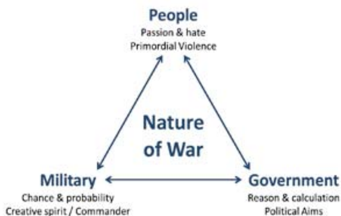
von Clausewitz' drievuldigheid.

Clausewitz bekeek het vanuit drie invalshoeken: zijn “drievuldigheid” van volk, politiek en krijgsmacht. Met een verdeeld en deels risicoovers politiek establishment enerzijds en een door nepnieuws ( fake news ) vertwijfelde westerse publieke opinie met weinig affiniteit met defensie anderzijds zal de militaire oplossing inderdaad weinig kans op slagen hebben. Zeker wanneer een revisionistische grootmacht als Rusland daarbij nog eens extra ambiguïteit creëert door agressieve propaganda, subversieve acties en de inzet van vermomde strijders en gewapende burgers of “protestanten” in niet-gedeclareerde conflicten.