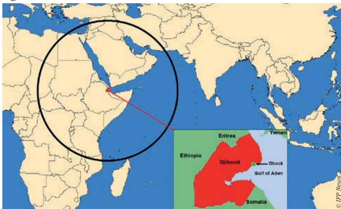
China's nieuwe overzeese maritieme basis in Obock, Djibouti

China ziet zijn huidige acties (zoals zijn claim in de Zuid- en Oost-Chinese Zee en de inrichting van een voorwaartse basis in Obock, Djibouti) als legitiem.