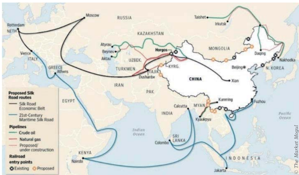
Visualisering van de Nieuwe Zijderoute

Stellen dat dit continent ook belangrijk is voor de EU is een open deur intrappen. Het is precies op dit continent waar de economische belangen van zowel de EU als China aan de oppervlakte komen. Deze laatste speler lijkt echter de bovenhand te hebben.