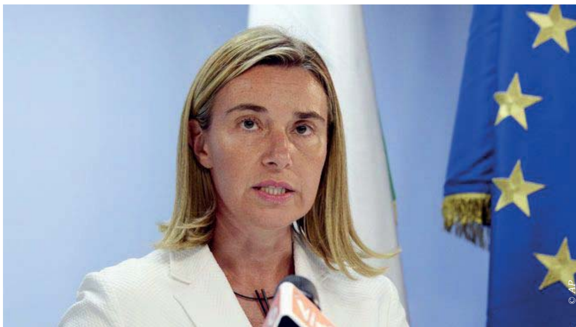
Federica Mogherini (hoge vertegenwoordiger voor Buitenlandse Zaken en Veiligheidsbeleid)

Aangezien ons lot dermate economisch verstrengeld is en een opkomend conflict zowel voor het merendeel van Oost- en Centraal-Azië als voor de Verenigde Staten gevolgen zal hebben, is het van cruciaal belang om de aspiraties van China in kaart te brengen.