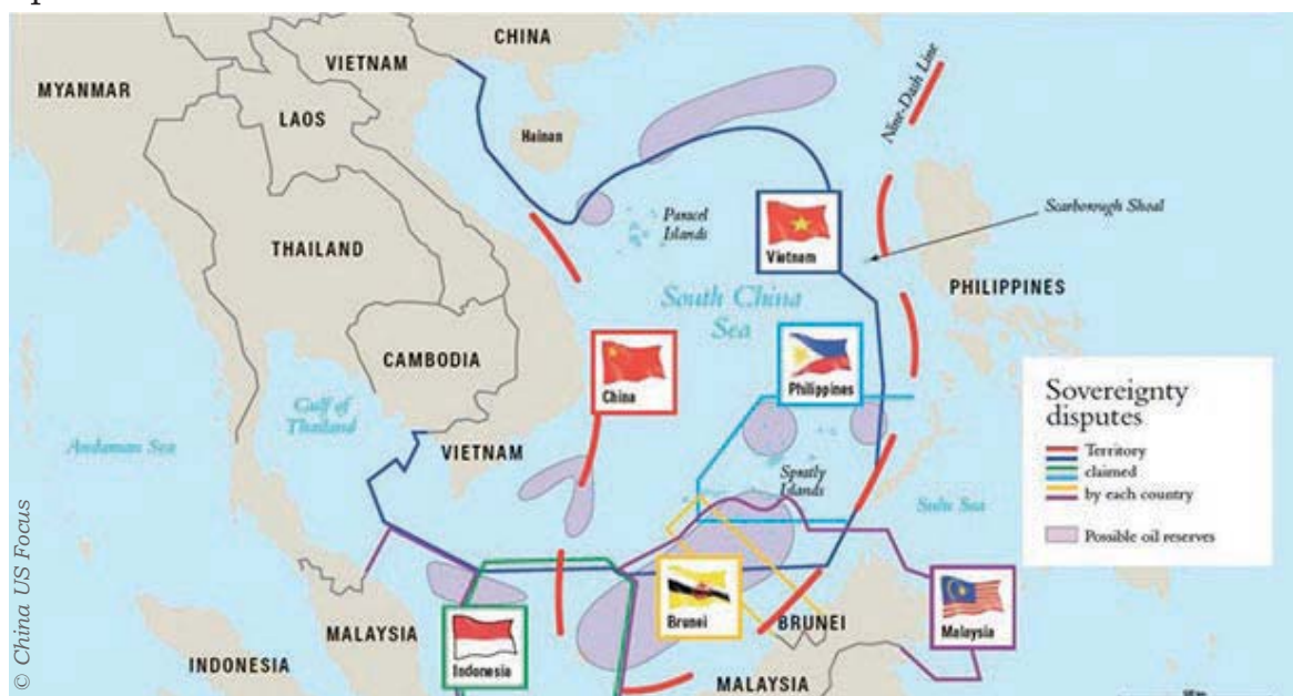
De ZCZ en de Negen-strepenlijn

Bovendien kenmerkt de regio zich door een ongelijke ontwikkeling en verdeling van rijkdom, onopgeloste grensgeschillen en territoriale claims op zee.