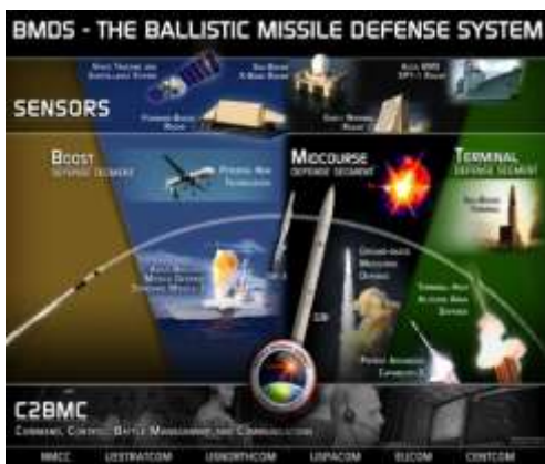
Het Amerikaanse Ballistic Missile Defence-systeem

Commando- en controlesystemen moeten zeer snel de nodige informatie verwerken en uitwisselen tussen de verschillende sensoren en wapensystemen die in het netwerk opgenomen zijn. Gezien de grote en snel te overbruggen afstanden maken deze systemen gebruik van satellietcommunicatie. De NAVO beschikt over een BMD Operations Centre (BMDOC), dat zich in Ramstein (Duitsland) bevindt en sinds 2012 operationeel is. Hier volgen teams in een beurtsysteem 24 uur per dag de