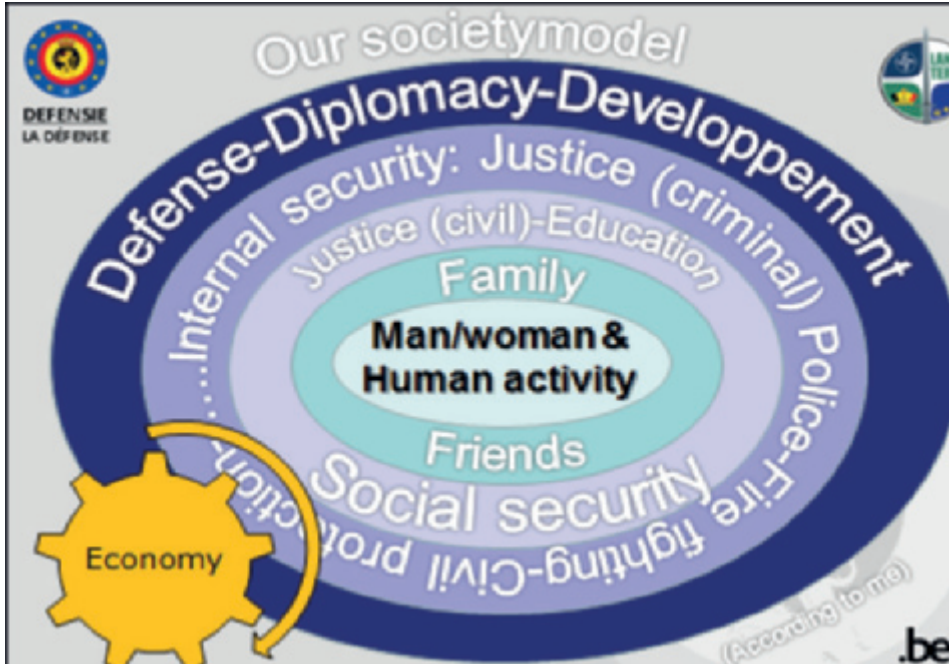
Figuur 1. Ons maatschappijmodel zoals ik het zie.