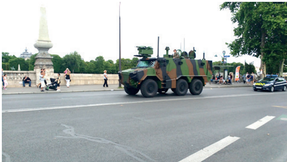
Een Griffon op weg naar het 14 julidefilé te Parijs

Op het internationale toneel kreeg dit akkoord wel zichtbaarheid met de ondertekening van een intentieverklaring door de Belgische minister van Defensie en de Franse ministre des Armées. Het beoogde partnerschap omvat niet enkel de aankoop van de Griffon- en Jaguar-voertuigen, maar ook het uitwerken van een capaciteitsontwikkelingsplan dat de samenwerking in alle ontwikkelingslijnen tussen de Belgische Landcomponent en de Franse Armée de Terre moet concretiseren.