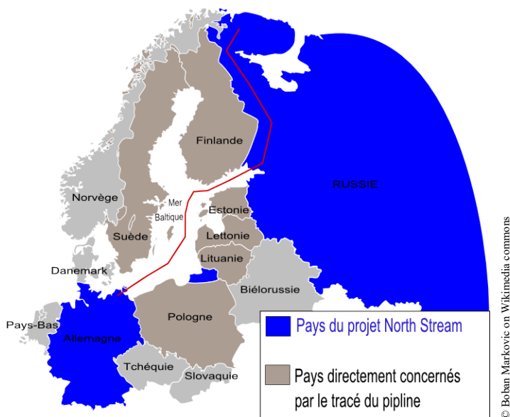
Le pipeline North Stream

En effet, fortement développé grâce aux relations personnelles établies entre le chancelier Schröder et le président Poutine, le partenariat entre l'Allemagne et la Russie n'a jamais été remis en cause par Angela Merkel. Depuis 2011, à la suite des sanctions liées à l'annexion de la Crimée, les échanges germano-russes ont baissé de 50 %, mais la Russie reste néanmoins le premier fournisseur d'énergies de l'Allemagne : elle couvre 40 % de la consommation de gaz et 30 % de la consommation de pétrole de la première puissance économique européenne. Il est à souligner toutefois que cette dépendance énergétique est relative. La Russie a peu d'alternatives d'exportation et dépend également de la technologie et des capitaux d'investissements allemands. Selon le point de vue du gouvernement allemand, ce projet était de toute manière fondamentalement une question économique. Berlin s'est retranché derrière le fait que diverses entreprises européennes, dont des entreprises françaises, ont investi massivement dans ce projet. Pour le gouvernement allemand, intervenir sur le marché privé du gaz européen aurait été une grave erreur politique. En effet, la libéralisation du marché du gaz a rendu possible une expansion considérable de l'approvisionnement énergétique de l'Europe en permettant aux entreprises – répondant ainsi aux signaux des marchés – de